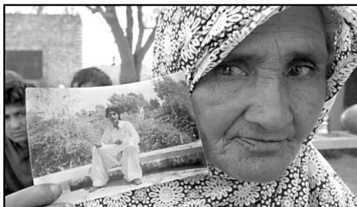
Una mujer paquistaní muestra la foto de un hijo, detenido y llevado por EE UU a Afganistán y Guantánamo.

Los aeropuertos de Tenerife Sur y San Juan, en Mallorca, han sido las dos únicas instalaciones españolas en las que estas cárceles volantes han hecho paradas, según descubrió una investigación del Diario de Mallorca . Mientras en el primero dos jets efectuaron cinco escalas en 2004, en el aeropuerto ma-