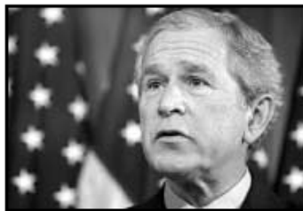
George Bush, presidente de EE UU.

D.M. El interés que ha despertado la ubicación de Canarias no sólo se demuestra con el hecho de haber sido usada como base estratégica en diferentes episodios de la historia. También se denota en otro acontecimiento que se fragua estos meses: la elección del Archipiélago como plataforma para el mayor desembarco empresarial de Estados Unidos en África Occidental. Según explicó el teldense Juan Verde, que fuera asesor de Bill Clinton en la Casa Blanca y que ha sido